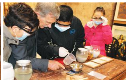
Laboratorio del sapone