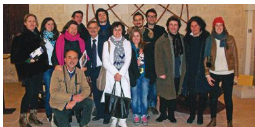
Con gli attuali proprietari del Castello di Amboise (Francia)

Percorso "Leonardo Tattile" (per non vedenti, su prenotazione)