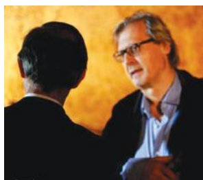
Con Vittorio Sgarbi