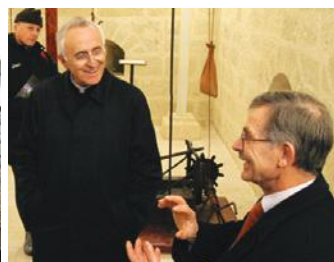
Con l'Arcivescovo di Lecce Mons. D'Ambrosio